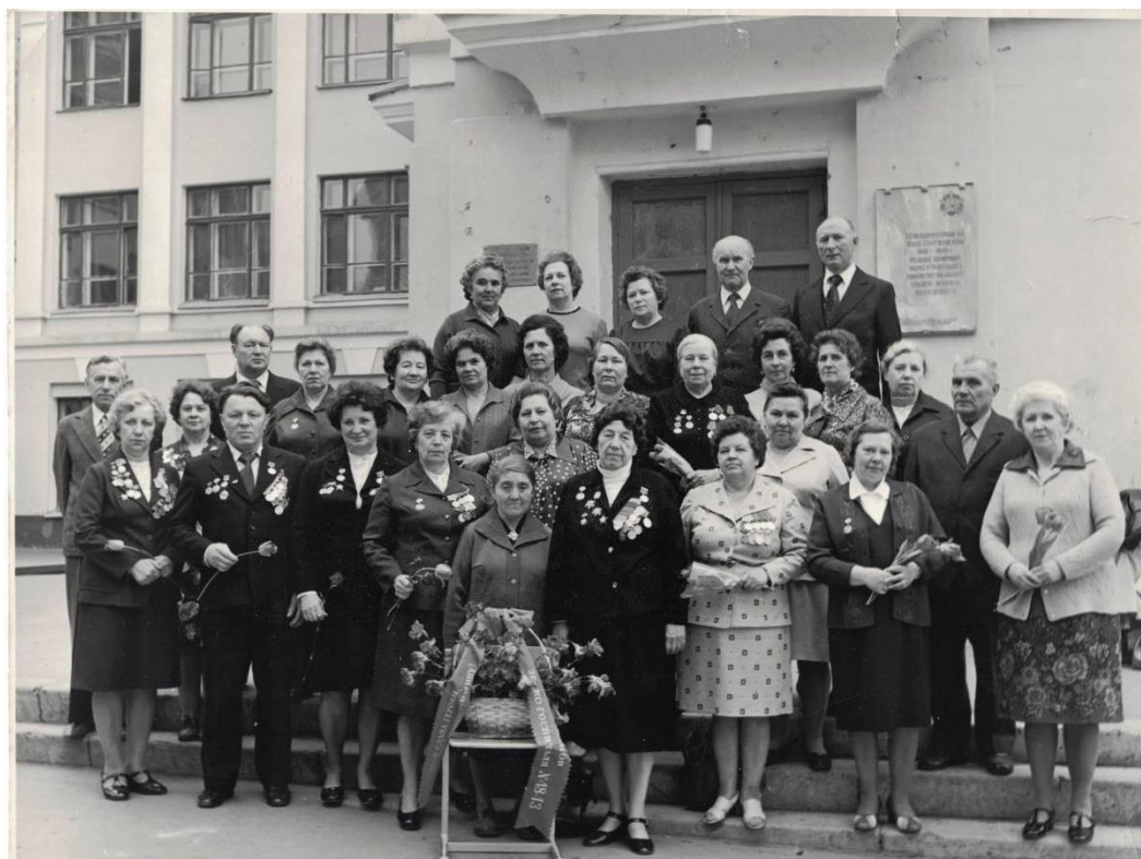
Фото 6. Встреча ветеранов эвакогоспиталя № 4843 у здания школы № 3 г. Кунцево, в котором он размещался в начале войны.